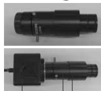
L-835 USBカメラ L-846 レンズ L-846-1 顕微鏡アダプター