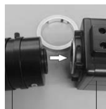
L-870 ズームレンズ L-851 フルHDカメラ

カメラ、レンズの保護キャップを外し、ねじ込んで接続します。 このとき、50mmマウントリングは外してください。 外し方についてはL-851の取扱説明書をご参照ください。