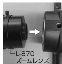
L-870 ズームレンズ L-860 モニター付カメラ